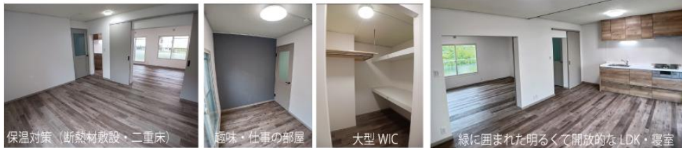
保温対策(断熱材敷設・二重床)