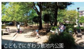
こどもでにぎわう敷地内公園