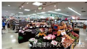
真物便利!スーパー直近