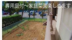
専用庭付~家庭菜園楽しめます

■物件概要 所在 千葉県船橋市緑台 2-9-2-104 / 種類 居宅 / 構造 RC造陸屋根5階建の1階部分 / 築年 S48年3月 / 権利所有権 / 管理費・修繕積立金・庭使用料 3,000円・7,800円・400円 / 固都税 37,600円(2023年) / 現況 空室